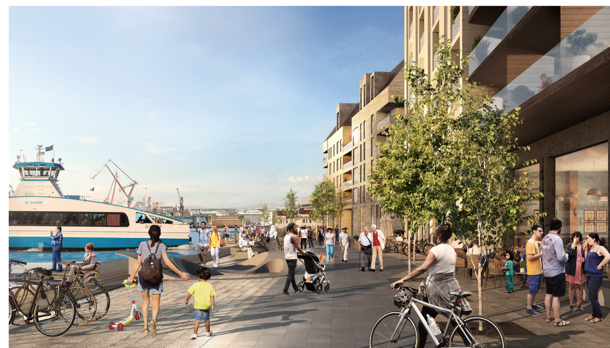
Illustrationsförslag med vy över den nya halvön samt kajen. Bild: Kanozi Arkitekter