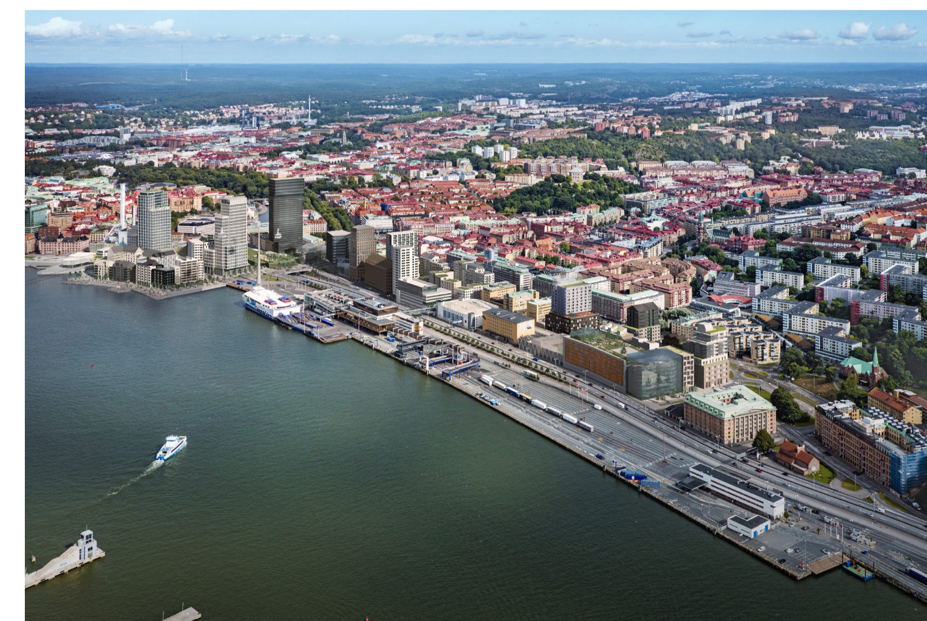
Masthuggskajen. Fotomontage: Kanozi Arkitekter