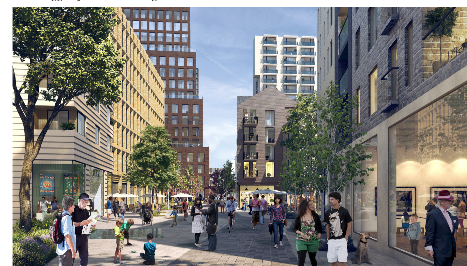
Illustrationsförslag med vy österut på Masthamnsgatan. Bild: Kanozi Arkitekter